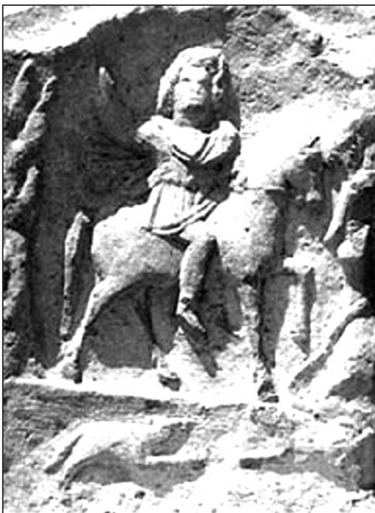
Fig. 1. Eroul Cavaler la vânătoare . Altar votiv descoperit în apropierea localității Traian, com. Cerna.

Herodot menționează vechimea cultului acestui erou, și amintește tradiția, conform căreia Herakles ar fi fost strămoșul agatyrșilor din Carpați, scytilor din stepele nord-pontice, și gelonilor din Podolia. Alături de eroizarea defunctului, conținută mai ales în mesajul ideatic al acestuia, și Hercules reprezenta un simbol al nemuririi, consecință a curajului moral, a luptelor dure, a suferințelor îndurate cu curaj pentru mântuirea omenirii. El se jertfește pentru oameni, fiind ridicat de pe rug din ordinul lui Zeus, și dus în Olymp, în rândul nemuritorilor.