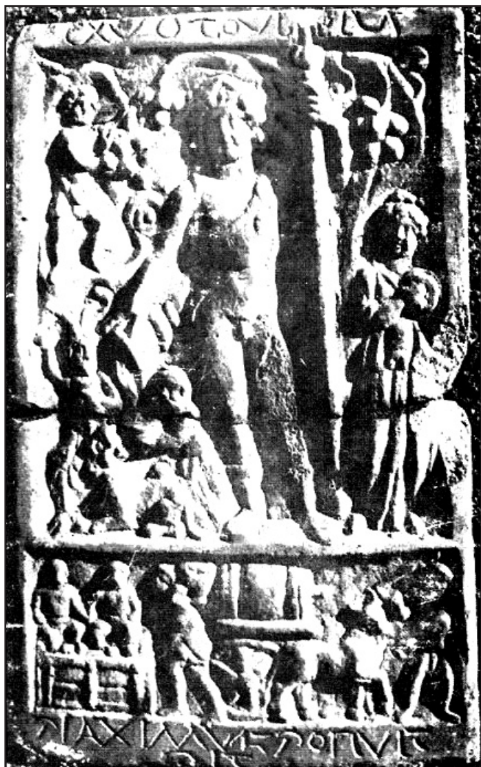
Fig.4. Dionysos – tabletă votivă provenită de la Făgărașu Nou

Simbolismul religios relevant în iconografia acestor divinități (și este important să urmărim cadrul natural în care sunt plasate iconografic acțiunile eroilor ) reprezintă un aspect particular al credințelor religioase despre viață și moarte ale populațiilor rurale romane din teritoriile dunărene, pentru care moartea echivala cu o nouă zămislire.