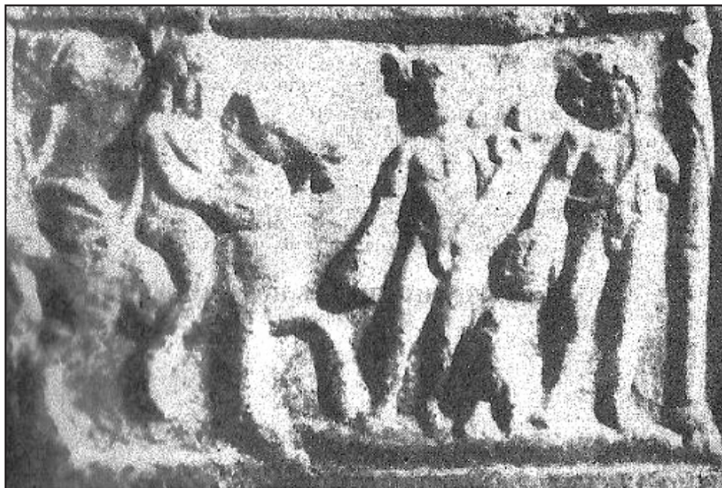
Fig. 5. Tabletă votivă din calcar, descoperită la Callatis, cu trei divinități asociate: Eroul Cavaler – Hermes – Dionysos.

Perpetuarea cultelor păgâne ale Eroilor în mediul tradiționalist al romanității rurale reprezintă dovada intensității procesului de romanizare a populației autohtone. Cinstirea Eroilor , identificați sincretistic cu vechi divinități locale populare, reprezintă un fenomen ce se reflectă în numărul impresionant de piese votive, plăcuțe și statuete, descoperite în teritoriile moesice. Vechilor credințe ale geto-dacilor, legate de cultul străbunilor, al sufletelor nemuritoare, li s-a adăugat în epoca romană conceptul religios al mântuirii.