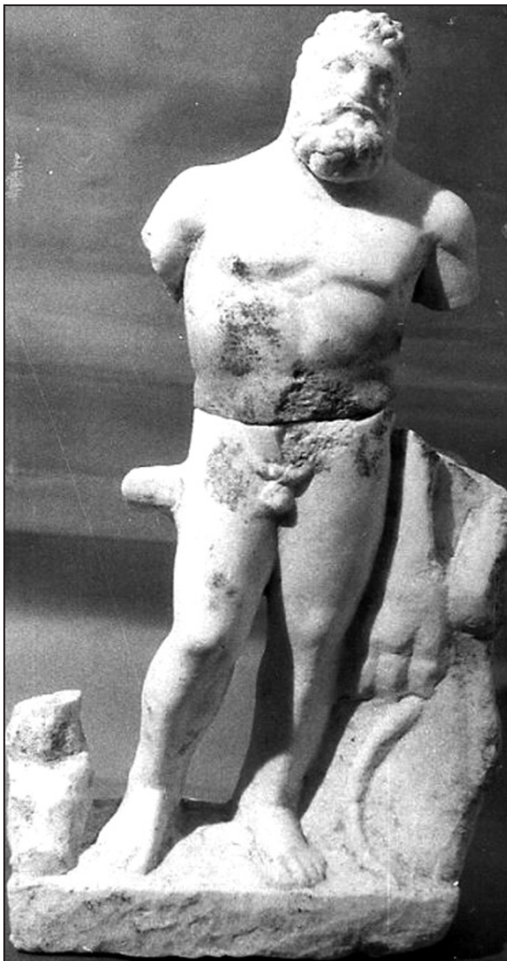
Fig. 2. Statuetă de marmură, reprezentându-l pe Hercules, descoperită în așezarea dela Telița-Amza

Se pare că adorarea lui Silvanus se făcea în locuri consacrate, în jurul unor altare plasate în