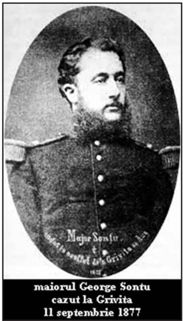
maiorul George Sontu cazut la Grivita 11 septembrie 1877

La 5 august 1878, Domnitorul Carol a dispus demobilizarea armatei române. În clipele de răgaz, scriind tatălui său, se referea la pământul dobrogean ce urma să intre în componența statului român, referindu-se și la Mangalia, „un sat mic”, cu importanță doar datorită faptului că aici s-ar putea construi un port bun, apărat de vânturile din nord și răsărit. Domnitorul și guvernul au luat hotărârea ca Dobrogea să fie ocupată întâi militar, cu regimentele 4, 5 și 7 Infanterie, 1 Artilerie și 2 Roșiori. A fost promulgată o lege prin care se puneau la dispoziția guvernului un milion de lei pentru luarea în stăpânire a Dobrogei și pentru primele organizări. În ședința Consiliului de Miniștri din 6 noiembrie 1878 a fost aprobată componența comisiei pentru instaurarea administrației civile, în fruntea acesteia fiind numit Nicolae Catargiu, comisar pentru Chestiunile trecerii Dobrogei în stăpânire românească.