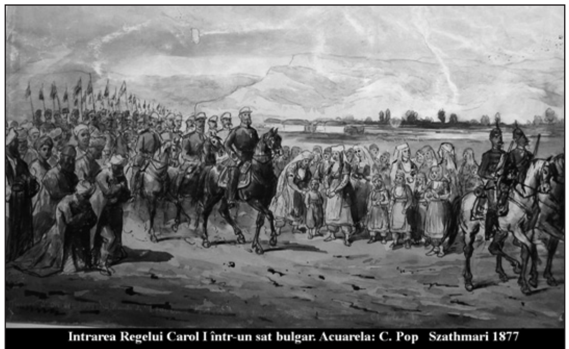
Intrarea Regelui Carol I într-un sat bulgar. Acuarela: C. Pop Szathmari 1877