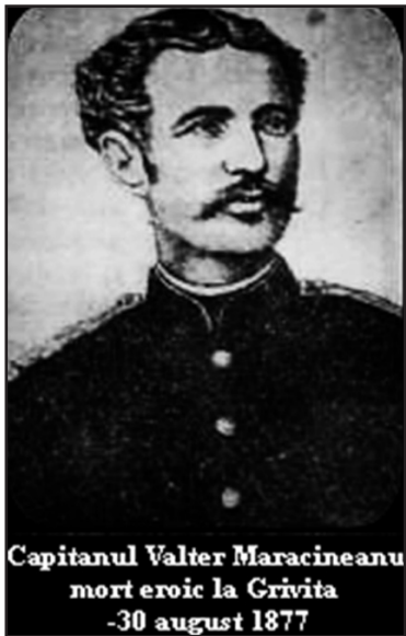
Capitanul Valter Maracineanu mort eroic la Grivita -30 august 1877