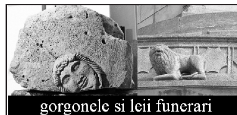
gorgonele si leii funerari

berbeci. Datorită acestui fapt, în antichitate triburile grecești erau cunoscute prin expresia „țapi”, iar perșii prin expresia „berbeci”. Aceste denumiri au fost menționate și în unele cronici referitoare la bătălia de la Marathon (490 î.H.) între