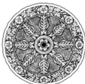
simbol Hindu al timpului

conține un adevărat sistem de simboluri religioase, ale