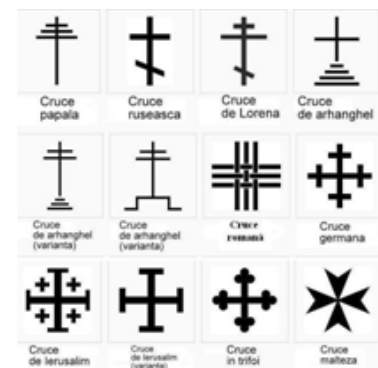
variante ale Crucii

CRUCEA CREȘTINĂ: simbolul Patimilor și Învierii.